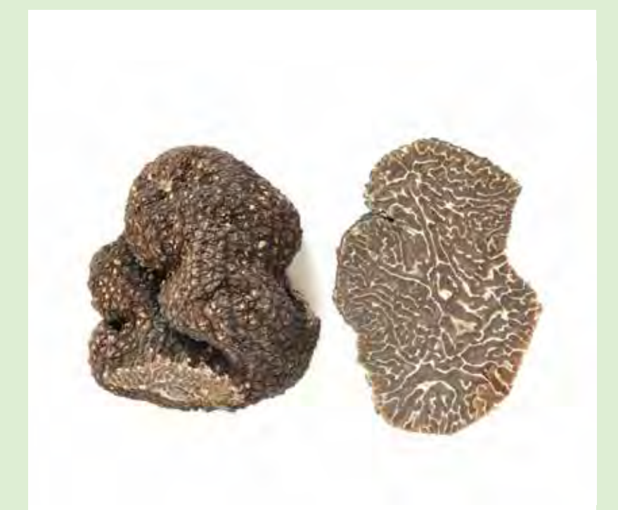
Muskattrüffel bzw. Wintertrüffel