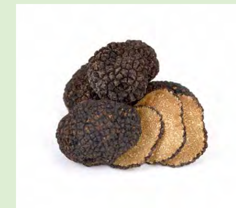
Herbsttrüffel bzw. Burgundertrüffel