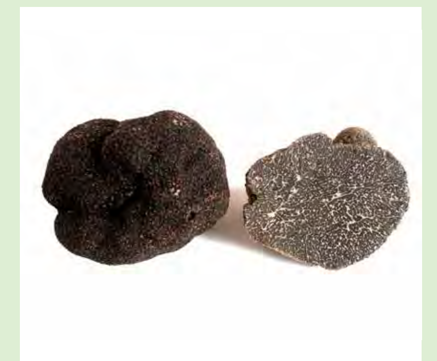
Winteredeltrüffel bzw. Périgordtrüffel